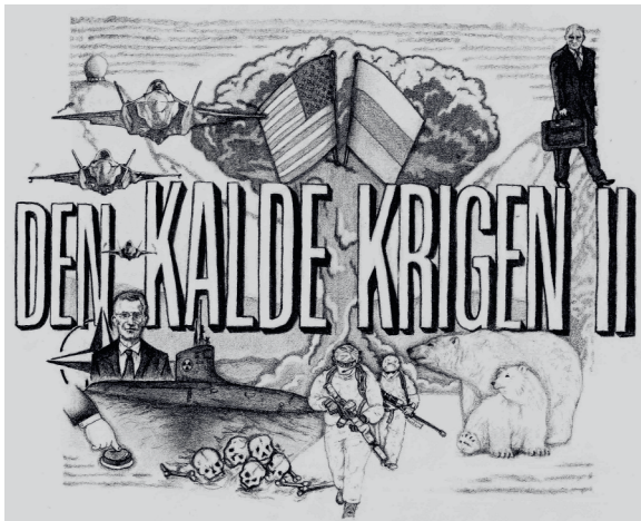
Det høye konfliktnivået i nordområdene og Arktis blir av mange sett på som en ny kald krig.

Hvis verden er preget av stormaktskonkurranse og rivalisering om land og områder med ressurser og markeder, må en spørre om en vil være med i denne konkurransen. Er det verdt prisen?.