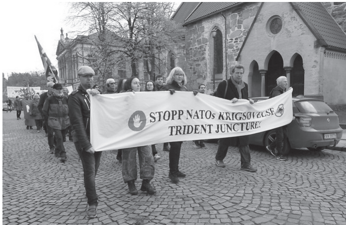
Fra demonstrasjon mot NATO-øvelsen Trident Junction 2018